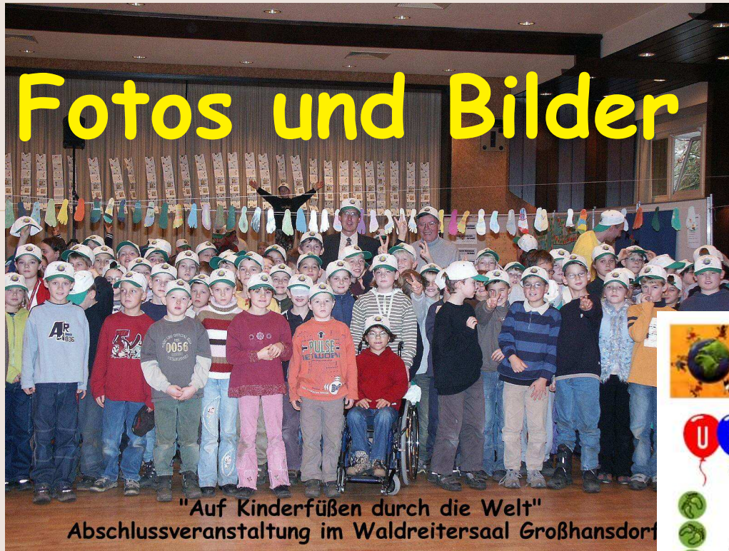
"Auf Kinderfüßen durch die Welt" Abschlussveranstaltung im Waldreitersaal Großhansdorf